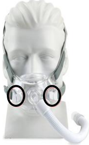
Figure 1 : masque facial Amara View

Les images des masques concernés sont présentées ci-dessous. Les clips magnétiques des harnais de ces masques sont entourés. Ces images peuvent servir de référence pour déterminer si votre masque ou celui de votre patient utilise également des clips magnétiques pour harnais. Ces masques sont destinés à fournir aux patients une interface pour l'application d'une thérapie par PPC ou à deux niveaux de pression. Les références des masques concernés et des composants des masques contenant des aimants sont répertoriées dans la figure 6.