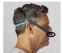
Figure 5 : masque de traitement 3100 NC/SP